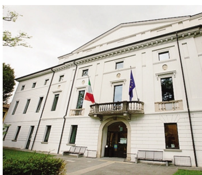
La biblioteca comunale di Seriate

L'adesione al contest fotografico, esteso a tutti i commercianti dei paesi aderenti al festival, va comunicata entro il 27 luglio a fiatoailibri.vetrine@gmail.com con oggetto