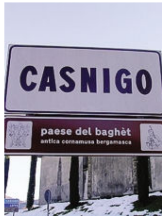
A Casnigo una giornata sulla cultura del baghèt

Ore 9,30-12,30, alla Ca' Parecia, via Foscolo, «Cibo è... Il giorno del raccolto» per riscoprire il piacere di una giornata nella natura raccogliendo le pannocchie di mai spinato; dalle ore 12,30, «Dal campo alla tavola» tipico pranzo bergamasco; ore 16,30-18, in piazza Vittorio Veneto, scartocciatura delle pannocchie, merenda, concerto degli «Aghi di Pino» e premiazione del concorso per le scuole secondarie «Cibo è... 140 caratteri e un clic» e per le scuole primarie «Cibo è... 140 caratteri e un disegno». Ore 18, sala consiliare, «Cibo è... Expo 2015 e le realtà locali» conferenza a cura dei Consiglieri regionali lombardi; dalle ore 20,30, al chiostro di S. Maria at Ruviales, via XX Settembre, «Cibo