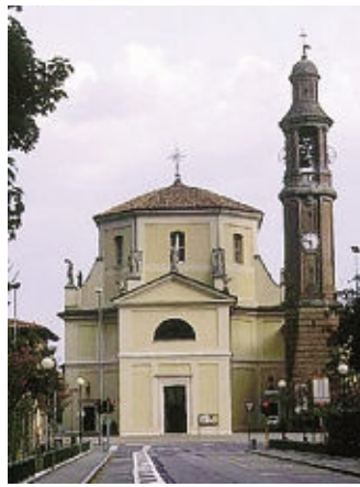
Torre Boldone festeggia i 150 anni della chiesa parrocchiale

Ore 18, nel salone Riccardi del Teatro Donizetti, presentazione di «Lucia di Lammermoor e Betty» ed esibizione degli allievi del Conservatorio Donizetti.