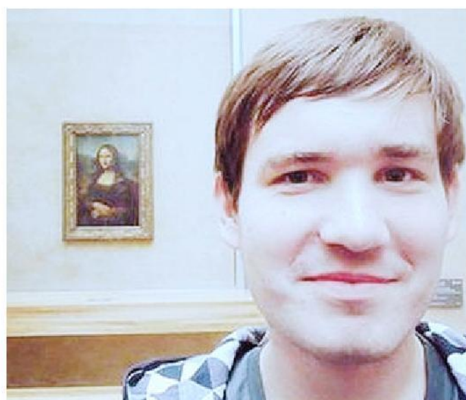
Selfie al Louvre, davanti alla «Gioconda» di Leonardo da Vinci

Malosfondo più ambito è quello del larario, o meglio ancora quello vietato, che fa tremare di eccitazione il polso di chi ha in mano un cellulare con videocamera. È allora che il richiamo a farsi un autoscatto, proprio lì davanti, diventa quasi ancestrale, un istinto per il selfie proibito che a Londra ha fatto capitolare persino una delle principali istituzioni dell'arte mondiale: la National Gallery. Non sono infatti bastate a preservarla le precau-